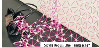
Sibylle Kobus: „Die Handtasche“